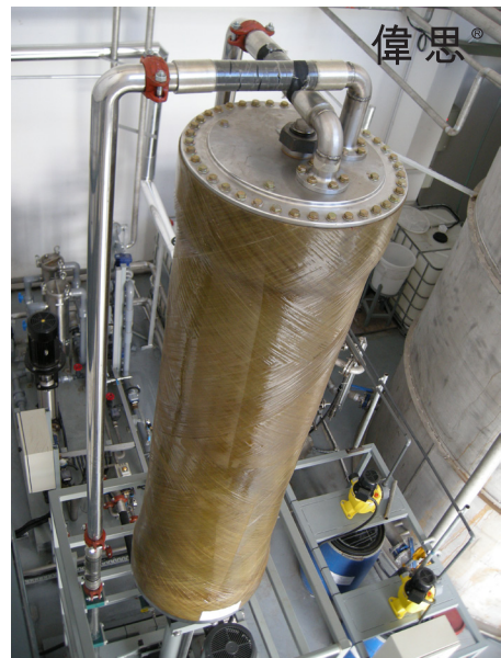
全物理方法進行中水回用

正昌為企業建議一套不用化學品，全物理方法的中水回用系統。此系統主要採用超濾的震動膜技術(VMAT UF)和卷式反滲透膜(RO)組成，把99%的除油污水循環至反滲透水平(COD低於檢測水平、導電率低於 10\mu\text{S}/\text{m}^2 )。